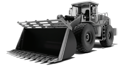
CARREGADEIRA SOBRE RODAS