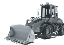
PALE GOMMATE COMPATTE