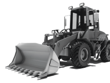
CARGADORES FRONTALES COMPACTOS