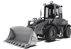
CARGADORES FRONTALES COMPACTOS